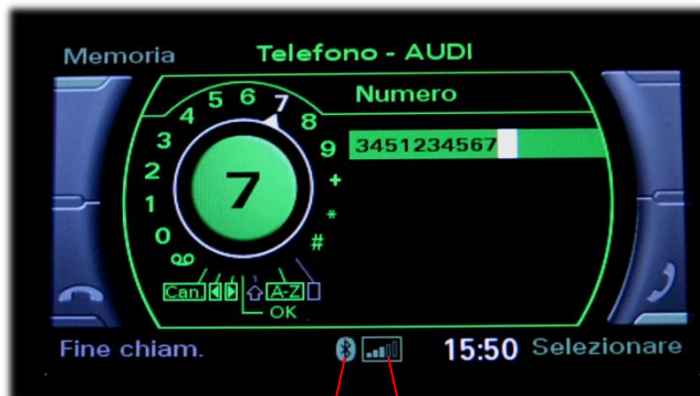
Simbolo Bluetooth presente con connessione attiva

E' possibile comporre manualmente il numero di telefono da chiamare, nel caso esso non sia presente nella rubrica del cellulare.